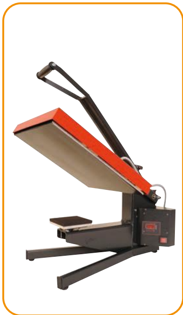
Fig. 1 - Prato de suporte para bolsos de peito, braços e t-shirts pequenas