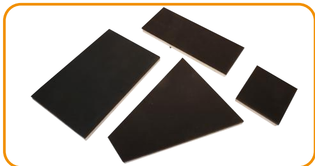
Fig. 3 · Pratos para t-shirt de mulher, oblongo, guarda-chuvas e quadrangular